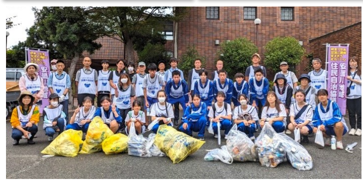
10月1日 クリーンアップ運動