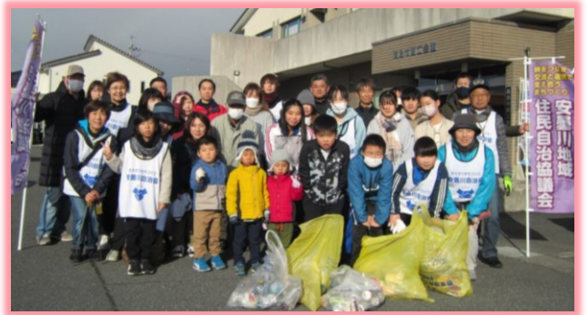
12月2日 クリーンアップ運動

地域の多様な世代の交流を図ることを目的に、令和四年度から継続して行っているクリーンアップ運動。今後でもできる限り長く続けていきたいと思っております。