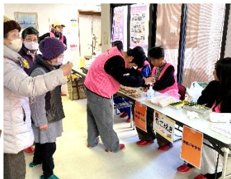
ボランティアまつり

今回は、安曇川中学校の生徒さんにボランティアとして来てもらい、準備から調理、販売、後片付けまでお手伝いしてもらいました。同会場でも十二月に開催されたボランティアまつりでも、安中生にボランティアとして参加してもらいましたが、地域の方との交流も楽しみながら、活動してくれているようです。次年度も、様々な活動を一緒に楽しんでいけたらと思います。